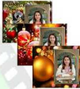
Carte de Noël