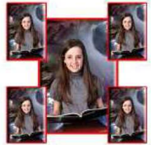
1-5x7 4-2.5x3.5 Magnétique