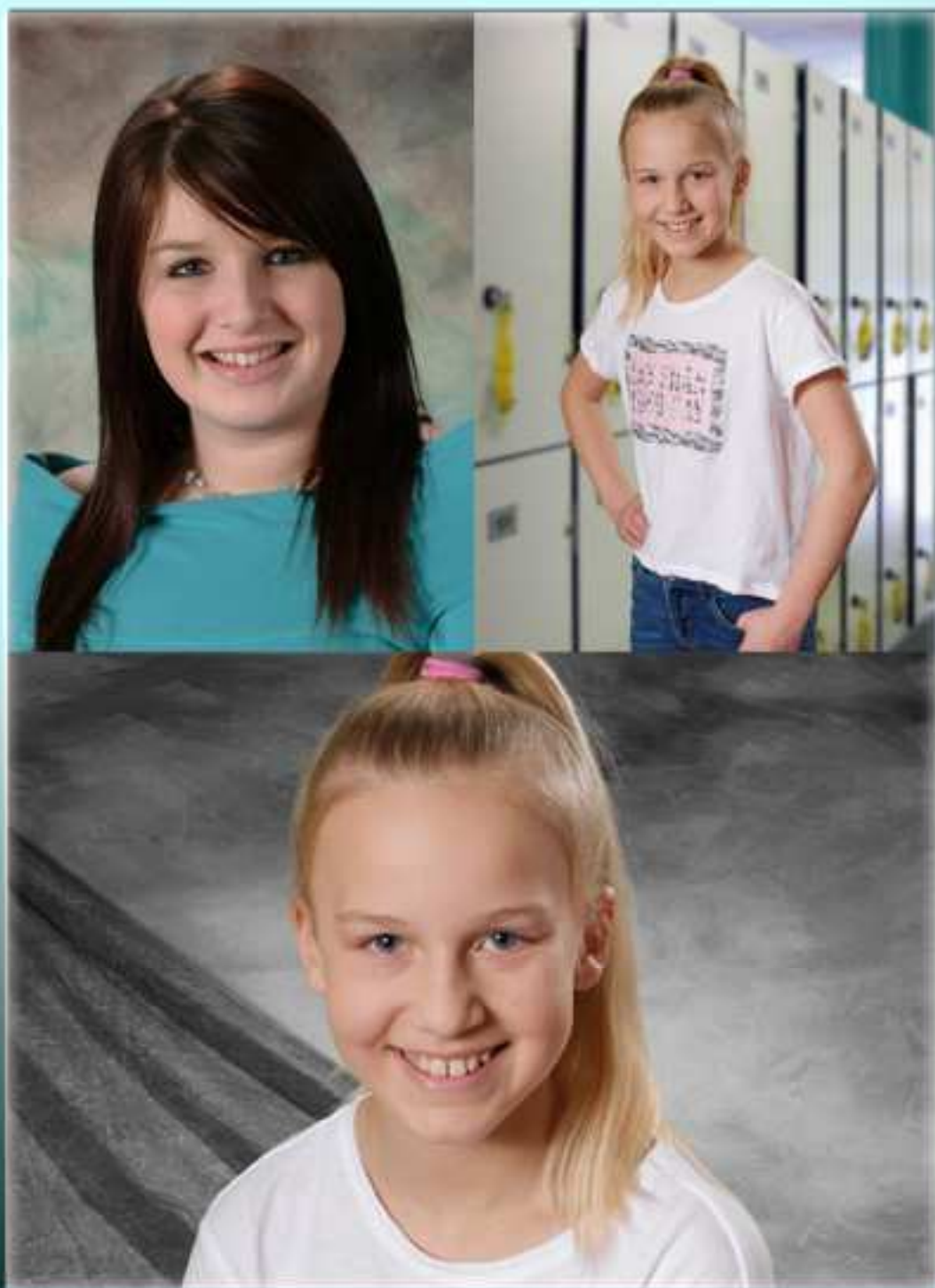
Photo recadrée pour le montage de la carte d'identité